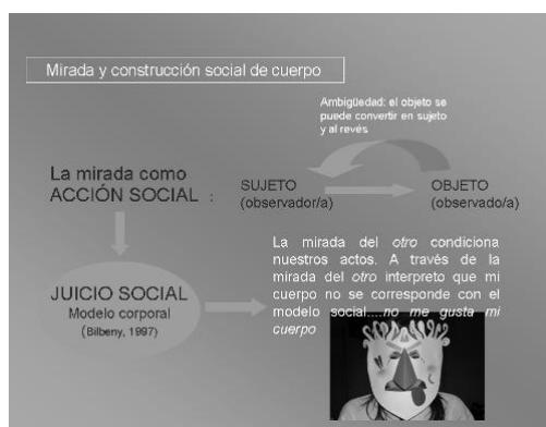
FIGURA 1: La mirada y la construcción social de cuerpo

Cuando se hace referencia a la construcción social del cuerpo se está destacando el proceso que toda sociedad realiza para establecer modelos corporales estándares (Bourdieu, 1986). Esta construcción social origina un modelo corpóreo, el cual, es anhelado por la mayoría de los integrantes de la comunidad. En consecuencia, existe una continua comparación con el estereotipo establecido, originando satisfacción o frustración dependiendo del resultado comparativo obtenido. Este ejercicio comparativo es posibilitado por la acción de mirar, la cual, ofrece la información necesaria para reconocer la distancia establecida entre la corporalidad del individuo y el modelo corporal constituido socialmente.